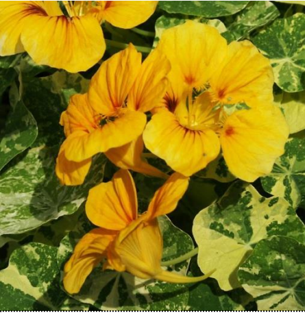
An der unteren Blüte kann man den Nektarsporn gut erkennen. Diese Sorte hat gefleckte Blätter.