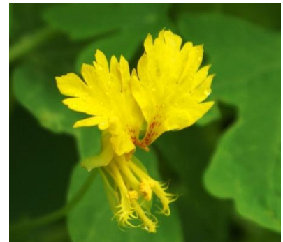
Die Kanarische Kapuzinerkresse, eine rankende Sorte. Die fransigen gelben Blüten sehen aus wie kleine Kanarienvögel.

Die Gewinner werden im Oktober auf der Homepage des Fördervereins foerderverein-finkensgarten@netcologne.de und im Nebelung-Newsletter http://shop.nebelung.de/newsletter-anmeldung bekanntgegeben!